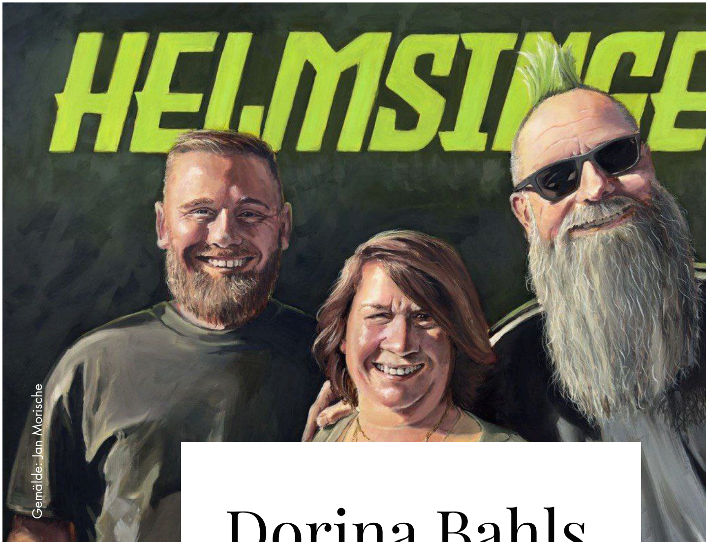
Gemälde: Jan Morische